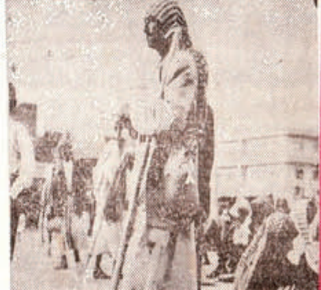
من أجل هؤلاء قامت الثورة

جئت ونشاب وكهل .. كلهم يريدو العاق .. غير ان منهم يهود خاليا ... ومع هلا المشه حملت كالميرت في البحر لاصور غسله ابنايا الخائبة ..