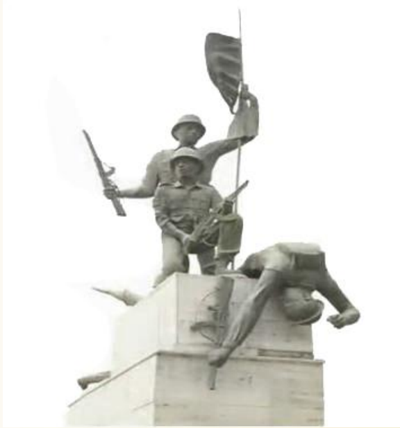
أبناء شعبنا الأبى يحيون بطولات الجيش العراقي الباسل في حرب تشرين عام ١٩٧٣