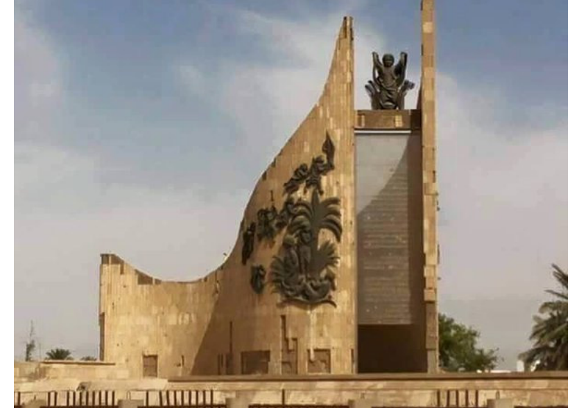
نصب بلاط الشهداء في منطقة الدورة - بغداد

13 تشرين الأول عام 1987 ( يوم الطفل العراقي ) عدوان ايراني على مدرسة بلاط الشهداء يؤدي لاستشهاد العشرات من الأطفال والمقيمين جوار المدرسة