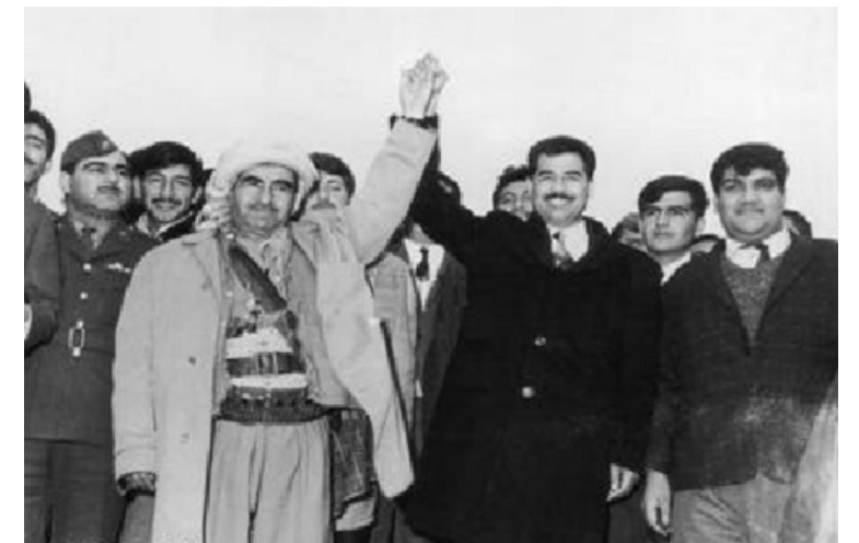
عملت قيادة الثورة على التوصل إلى حل سلمي وطني للقضية الكردية

لذا جاء الأداء السياسي للدولة ليعكس الاهتمام بالربط بين