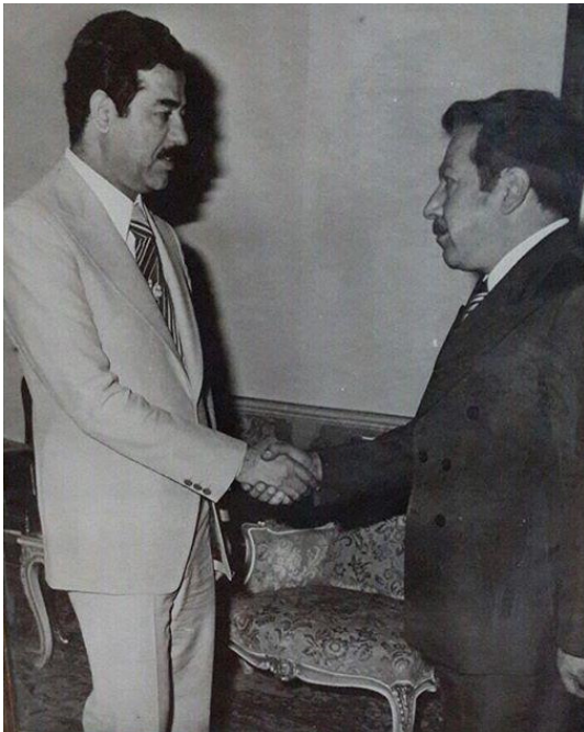
الرفيق الشهيد القائد صدام حسين يستقبل المرحوم هاشم حسن عقراوي رئيس المجلس التنفيذي لمنطقة كردستان للحكم الذاتي

8 تشرين الأول عام 1974 أعلنت بغداد عن صدور مرسوم جمهوري بتشكيل المجلس التنفيذي لمنطقة الحكم الذاتي برئاسة هاشم حسن عقراوي بعد اعتماد المجلس التشريعي لمنطقة كردستان لقائمة المرشحين لعضوية المجلس التنفيذي