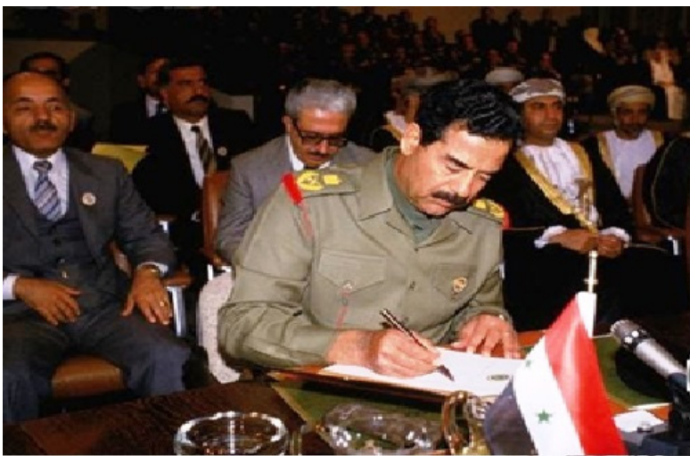
عمل العراق على تعزيز العمل العربي المشترك وتفعيل اجتماعات القمم العربية

من خلال تحليل أسباب ودوافع الأزمة، فلا يمكن تجزئة مشكلات: كالطاقة أو المياه، أو التلوث، أو شعب فلسطين، عن ظاهرة انعدام الاستقرار في المنطقة، لذا يفترض البحث عن حلول جذرية لجميع هذه المشكلات، إن "السلام مكسب كبير ومهم" وفق تصور السيد الرئيس الراحل، فمن الضروري قيام الأطراف المعنية إقليمياً ودولياً، بتقديم تضحيات من أجل تحقيق السلام دفاعاً عن الحرية والسيادة.