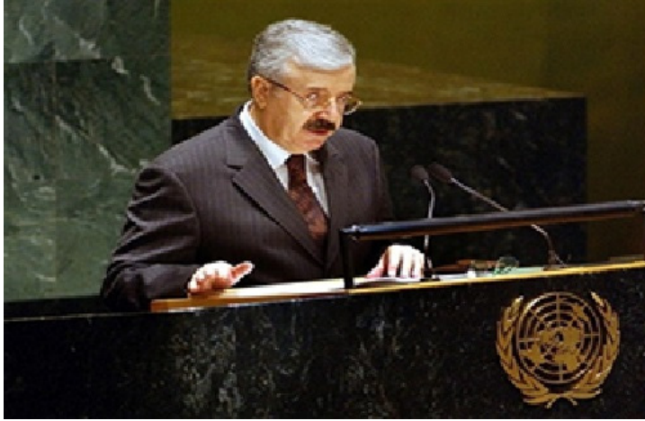
وزير خارجية العراق الدكتور ناجي الحديشي يعلن عام ٢٠٠٢ عودة مفتشي السلاح الدوليين في الأمم المتحدة في بادرة سلام عراقية

من خلال تحليل أسباب ودوافع الأزمة، فلا يمكن تجزئة مشكلات: كالطاقة أو المياه، أو التلوث، أو شعب فلسطين، عن ظاهرة انعدام الاستقرار في المنطقة، لذا يفترض البحث عن حلول جذرية لجميع هذه المشكلات، إن "السلام مكسب كبير ومهم" وفق تصور السيد الرئيس الراحل، فمن الضروري قيام الأطراف المعنية إقليمياً ودولياً، بتقديم تضحيات من أجل تحقيق السلام دفاعاً عن الحرية والسيادة.