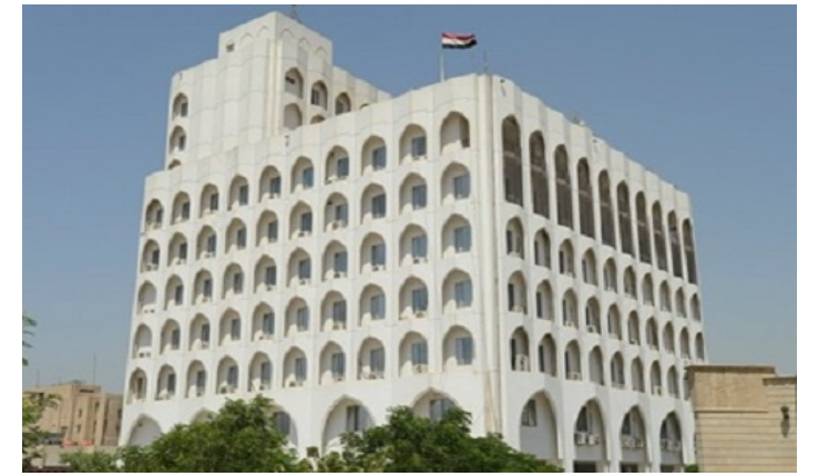
السفير الدكتور غازي فيصل حسين

الموضوع: محاولة لتحليل المبادئ والقواعد الإيديولوجية للقومية العربية إضافة للأهداف التطبيقية، والمتغيرات السياسية العربية والدولية، بمعنى آخر: تحليل المضمون النظري، وإدراك عناصر واتجاهات السياسة الخارجية للعراق، التي مهدت لظهور دولة جوهريّة للتوازن الإقليمي.