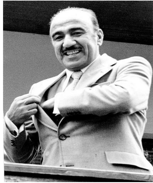
الرفيق صالح مهدي عماش

8 تشرين الأول عام 1963 أعلنت بغداد ودمشق عن الوحدة العسكرية بين العراق وسوريا بجيش واحد وقوات مسلحة واحدة يشرف عليها مجلس عسكري أعلى موحد يضم أعضاء من القطرين برئاسة القائد العام للقوات المسلحة الموحدة، وتم اختيار الرفيق صالح مهدي عماش الذي كان آنذاك برتبة فريق ركن ويشغل موقع وزير الدفاع في العراق قائداً عاماً للقوات المسلحة الموحدة بينما اختيرت دمشق كمقر للقيادة الموحدة للجيش، الا أن هذه الخطوة الوحدوية الهامة على طريق الوحدة الاتحادية بين القطرين اغتالتها ردة