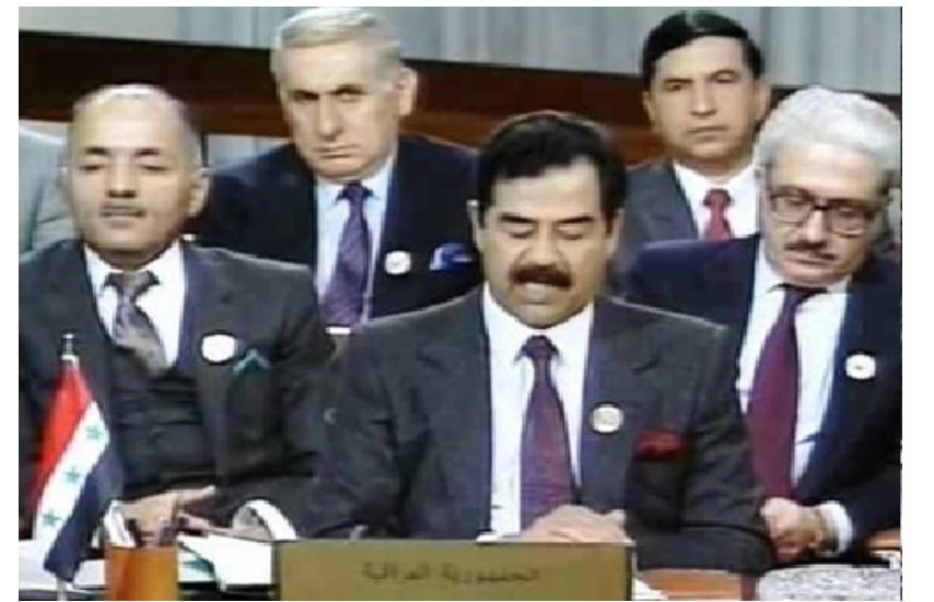
الاجتماع الثاني لمجلس التعاون العربي في عمان ١٩٩٠

ومن هذه المنطلقات كان اهتمامه بإنشاء مجلس التعاون العربي مع مصر والأردن واليمن، في خطوة عملية لتعزيز التكامل العربي وترسيخ المبادئ الوجودية.