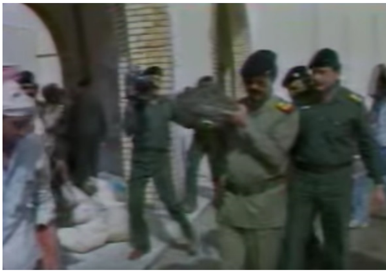
صورة للشهيد صدام حسين رحمه الله وهو يشارك في حملة اعمار مدينة الفاو .. مدينة الفداء وبوابة النصر العظيم

أن أقر بعض المنطلقات النظرية وأوصى باتمام الوحدة الاتحادية بين قطري العراق وسورية 25 تشرين الأول ( يوم الضاد في العراق ) يوم الوفاء والعرفان للغة العربية رمز وحدة العرب وهويتهم الخالدة 25 تشرين الأول عام 1989 الانتهاء من حملة اعمار الفاو مدينة الفداء وبوابة النصر العظيم