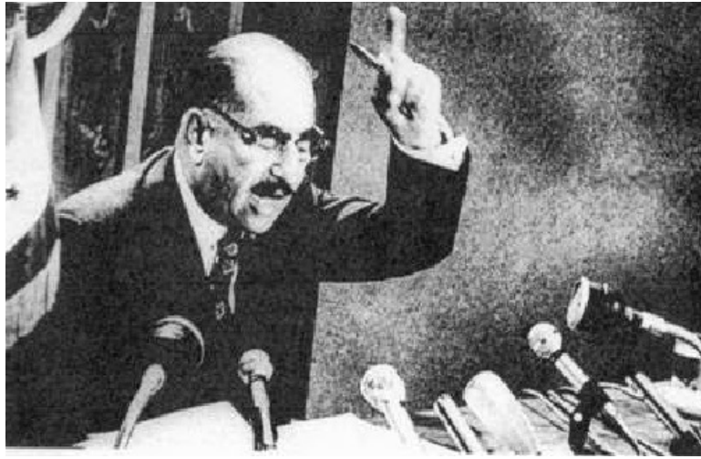
الاب القائد المرحوم احمد حسن البكر يعلن قرار التاميم الخالد

٢ / 1 - العلاقة بين الوطني والقومي إن العراق في رؤية السيد الرئيس الزاحل صدام حسين، جزء من الأرض الأوسع، الوطن العربي، وله دوره على الصعيدين الإقليمي والبشري في تحقيق حالة الوحدة وتصفية حالة التجزئة. إن العمل الموحد في رؤية سيادته يستند إلى عاملين: "العامل