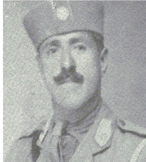
العقيد الركن صلاح الدين علي الصباغ عندما كان برتبة ملازم اول

16 تشرين الأول عام 1945 أقدم النظام الملكي في العراق على اعدام الشهيد العقيد الركن صلاح الدين الصباغ لكونه أحد قادة ثورة مايس التحررية عام 1941