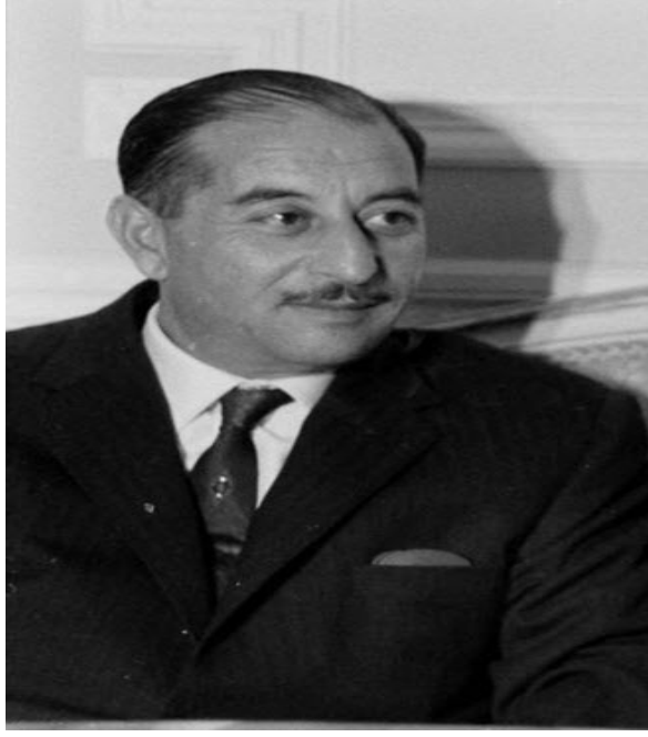
الرفيق الأب القائد أحمد حسن البكر

الهام في الجيش وفي الحزب وفي المنجزات التي تحققت ابان شغله للموقع الأول في قيادة الحزب والدولة وأعلن الحداد في العراق لمدة أسبوع على الفقيه الراحل كما نعاه الرفيق القائد المؤسس أحمد ميشيل عفلق والعديد من المسؤولين في الدولة والحزب