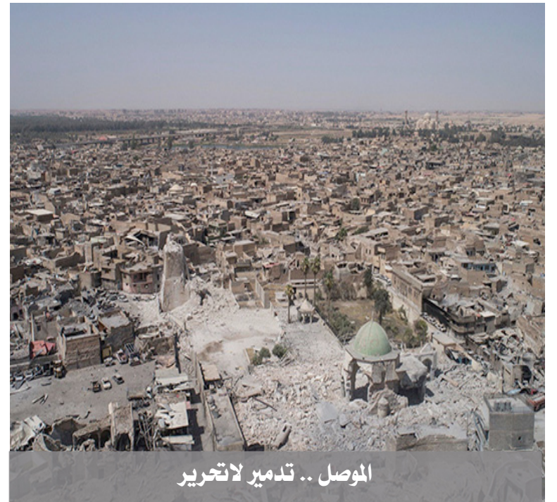
الموصل .. تدمير لا تحريير

تصاعد الصراع بين اطراف العملية السياسية المخابراتية وانحدارها في درك السقوط النهائي والحتمي