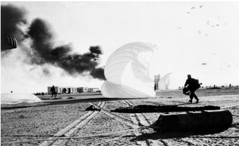
فوج المظليين البريطاني في اول عملية انزال على مطار الجميل، بور سعيد

29 تشرين الأول عام 1956 تعرضت مصر للعدوان الثلاثي البريطاني الفرنسي- الصهيوني الذي فشل فشلاً ذريعاً حيث جوبه بمقاومة باسلة من المصريين مدنيين وعسكريين- والمتطوعين العرب