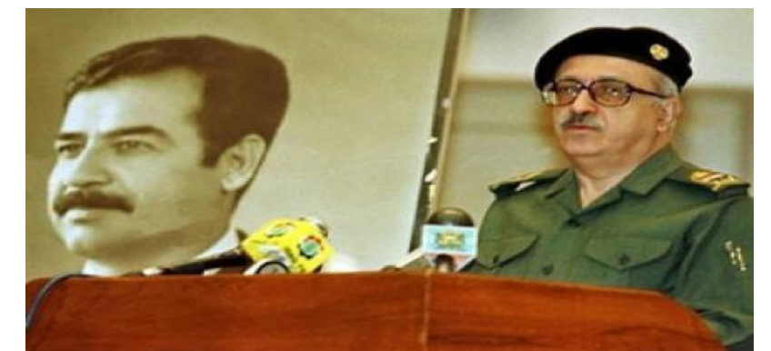
الرفيق الشهيد طارق عزيز

٥ حزيران عام ٢٠١٥ استشهد الرفيق المناضل طارق عزيز العضو في القيادتين القومية والقطرية لحزب البعث العربي الاشتراكي وفي مجلس قيادة الثورة ونائب رئيس مجلس الوزراء قبل احتلال العراق