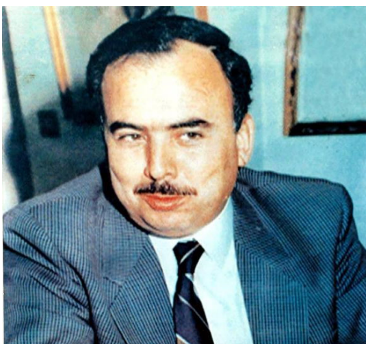
الرفيق عبد الرحيم أحمد

٣٠ حزيران عام ١٩٩١ انتقل الى رحمة الله الرفيق المناضل عبد الرحيم أحمد الأمين العام لجبهة التحرير العربية أمين سر قيادة التنظيم الفلسطيني لحزب البعث العربي الاشتراكي عضو اللجنة التنفيذية لمنظمة التحرير الفلسطينية