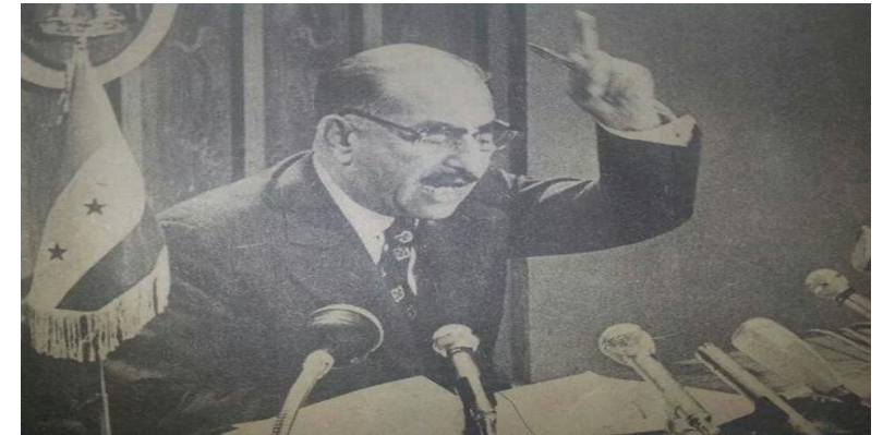
الرفيق الأب القائد أحمد حسن البكر يعلن قرار تأمين النفط العراقي

١ حزيران عام ١٩٧٢ أصدر مجلس قيادة الثورة القانون الخالد رقم ٦٩ لعام ١٩٧٢ قانون تأمين عمليات شركة نفط العراق المحدودة الذي نجح بتأمين النفط العراقي وتحريره من هيمنة شركات النفط الأجنبية الاحتكارية وقد أعلن الرفيق الأب القائد أحمد حسن البكر في خطابه الموجه للشعب والأمة قرار مجلس قيادة الثورة التاريخي في ذلك اليوم الأغر