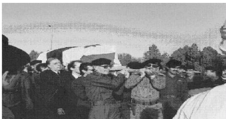
الرفاق القائد صدام حسين وعزة ابراهيم وعبد المجيد الرفاعي يحملون جثمان الرفيق القائد المؤسس أحمد ميشيل عفلق

٢٣ حزيران عام ١٩٨٩ انتقل الى رحمة الله الرفيق المناضل القائد المؤسس لحزب البعث العربي الاشتراكي أحمد ميشيل عفلق وقد تم تشييع جثمانه في بغداد بحضور الرفيق القائد المناضل الشهيد صدام حسين وعدد من كبار المسؤولين في الدولة والحزب كان من بينهم الرفيق القائد المناضل عزة ابراهيم والرفيق المناضل عبد المجيد الرفاعي