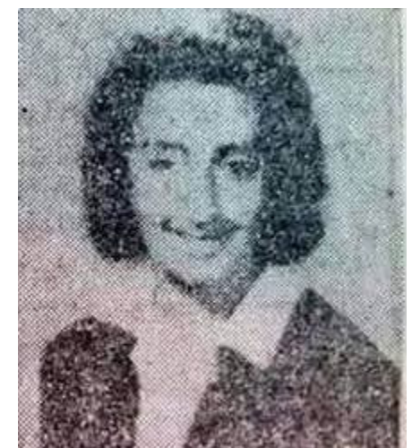
الشهيدة هناء الشيباني

١٧ آذار عام ١٩٧٠ استشهد هناء الشيباني الفدائية العراقية في المقاومة الفلسطينية اثر غارة صهيونية على مدينة اربد الأردنية وتم تشييع جثمانها في بغداد بمشاركة جماهيرية واسعة وبحضور عدد من المسؤولين في الدولة والحزب والاتحاد العام لنساء العراق والمقاومة الفلسطينية