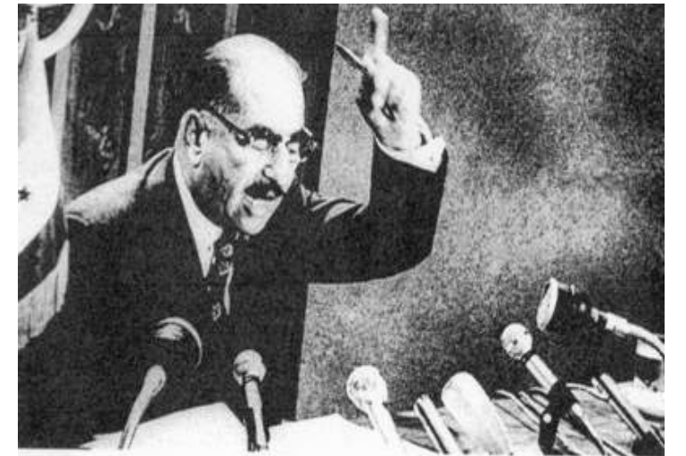
الرئيس احمد حسن البكر يعلن قانون تأميم شركة نفط العراق

١ آذار عام ١٩٧٣ انتصار العراق على شركات النفط الأجنبية الاحتكارية ورضوخها لقرار العراق التاريخي بتأميم نفطه