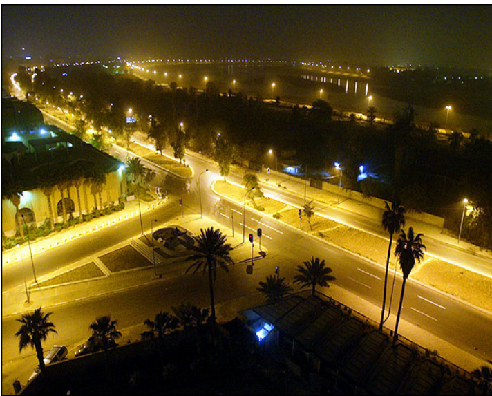
بغداد قبل ان يدنسها الغزاة والمجرمين

يواصل الكتاب والصحفيون والمثقفون والفنانون العراقيون كفاحهم الفكري والثقافي والاعلامي والتعبوي مؤازرين اخوانهم المقاتلين في سوح الجهاد مسطرين بمداد اقلامهم اروع صور البسالة والتضحية والجهاد فلقد اختلطت دماهم الزكية الطاهرة بقان الدم الطهور للمقاتلين الفاديين في سوح الوغى سوح الجهاد والقتال وهكذا هو الجهاد ديدن المقاتلين الذين يشارك فيه اليوم المثقفون العراقيون الاشراف برجالهم ونسائهم بشيوخهم وشبابهم بكل ما اوتوا من قدرات ثقافية وكتابية يوظفونها لخدمة مسيرة الجهاد والتحرير الظاهرة مستعينين العزم من دعم اخوانهم المثقفين والكتاب والصحفيين والادباء العرب الذين ازروهم في سنين كفاحهم المريير ضد قوى الاستعباد والاحتلال والتجزئة والاستغلال والتخلف كما انهم يحضون بدعم زملائهم من الكتاب والصحفيين والادباء من شرفاء العالم واحراره .. فالمثقفون العراقيون والعرب ومثقفو العالم اجمع يتشاركون الايمان والوعي بوحدة المصير والمستقبل الذي يصنعه مداد الامه التي تنضح بالكلمة الحرة الشريفة التي تفعل فعل الرصاصة وتؤكد حقيقة ان القلم والبنديقية فوهة واحدة وهكذا تحدث فوهات الاقلام والبنادق لترسم الصورة الزاهية لنصرنا الحاسم وظفرنا الاكيد .