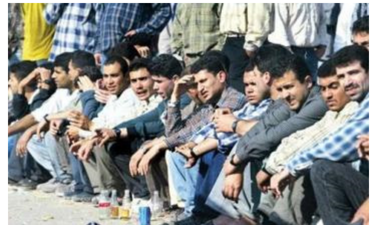
البطالة في العراق : ٤ ملايين عاطل عن العمل

دخل الاحتلال على العراق الذي مضى على تطبيق حصار جائر ظالم عليه قرابة أربعة عشر عام ، حصار كسر عظامه وهشم امكاناته الاقتصادية التي تمتع بها أبناءه قبل الحصار، حصار أعاد الأمية الى المجتمع وأجبر ربما الملايين من العراقيين على مغادرة وطنهم بحثا عن لقمة العيش، حصار حاصر نفسية الانسان العراقي وأدخل الكراهية بأنفسهم وبنظامهم وبرجاله مع الادراك والتسليم بشرفهم واخلاصهم وعفتهم وتمكن الاعلام المعادي للعراق وشعبه من التوغل الى العقول فخرّب الكثير منها . غير ان أخطر ما أنتجه الحصار هو الجوع والمرض والامية كنتاج من نواتج البطالة. وقد تعاونت هذه العوامل مجتمعة لتقدم للاحتلال منافذ يدخل منها على شعبنا ويمعن في التخريب.