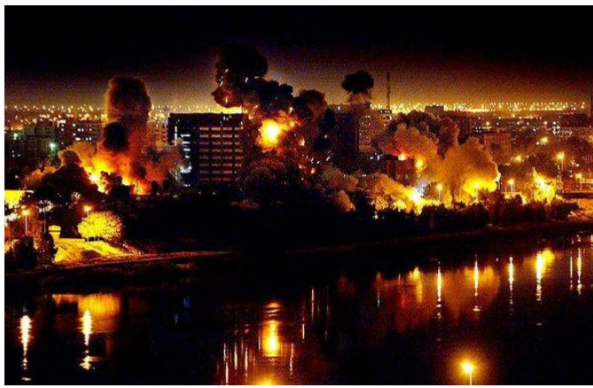
بغداد فجر يوم العدوان الغاشم على العراق في ٢٠ آذار ٢٠٠٣

٢٠ آذار عام ٢٠٠٣ بدأ العدوان الأمريكي البريطاني الغربي الصهيوني الأطلسي الغاشم على العراق بمشاركة ايرانية غير مباشرة لتنتقل معركة الحواسم وقد استتبسل شعب العراق في المقاومة التي قادها مناضلي البعث وصناديد القوات المسلحة