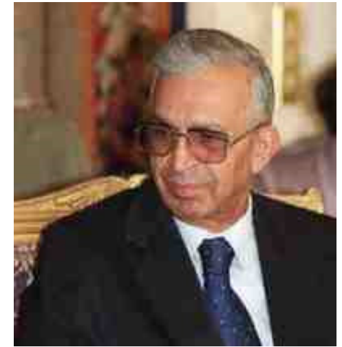
الله الرفيق سعدون حمادي

١٥ آذار عام ٢٠٠٧ انتقل الى رحمة الله الرفيق سعدون حمادي رئيس المجلس الوطني قبل الاحتلال ويعد الفقيد من الرعيل الأول لحزب البعث العربي الاشتراكي في العراق وقد سبق له نيل عضوية قيادة قطر العراق للحزب ومجلس قيادة الثورة كما سبق له أن شغل موقع وزير الاصلاح الزراعي بعد ثورة ٨ شباط ١٩٦٣ ورئيس مجلس الوزراء ووزير الخارجية والنفط بعد ثورة ١٧-٣٠ تموز ١٩٦٨ والعديد من المهام في الدولة والحزب