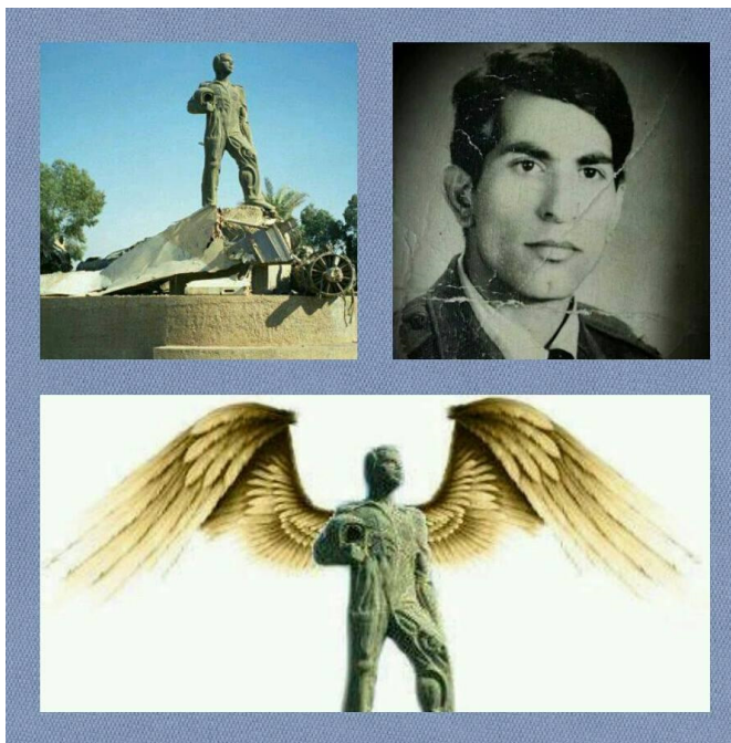
الشهيد الملازم الأول الطيار عبد الله لعبيبي

١٥ تشرين الثاني عام ١٩٨٠ استشهاد الملازم الأول الطيار عبد الله لعبيبي بعد أن قاد عملية بطولية ضد الطائرات الايرانية المعتدية في سماء شمالي العراق