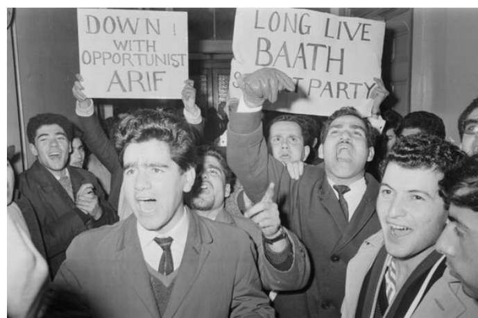
تظاهرات بعثية في المهجر رفضاً لردة ١٨ تشرين الثاني السوداء عام ١٩٦٣

١٨ تشرين الثاني عام ١٩٦٣ وقعت ردة تشرين السوداء التي اغتالت ثورة ٨ شباط في العراق بعد أن نفذ عبد السلام محمد عارف الذي عينه الحزب رئيساً للجمهورية انقلاباً عسكرياً غادراً ضد سلطة البعث الثورية وشن حملة ارهابية ضد مناضلي الحزب الذي قاوموا الردة بكل بسالة وقدموا العديد من الشهداء كما شهدت العديد من بلدان العالم مسيرات للبعثيين العرب تدين وتشجب الردة التشرينية