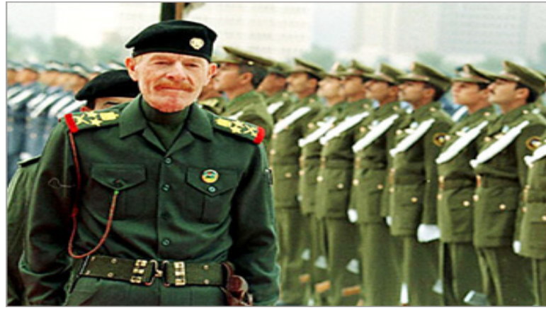
جلالة الأخ الملك عبد الله الثاني بن الحسين الموقر ملك المملكة الأردنية الهاشمية

اشبال الأردن والعراق ومعلميهم قرب البحر الميت واصابة عدد آخر بجروح.