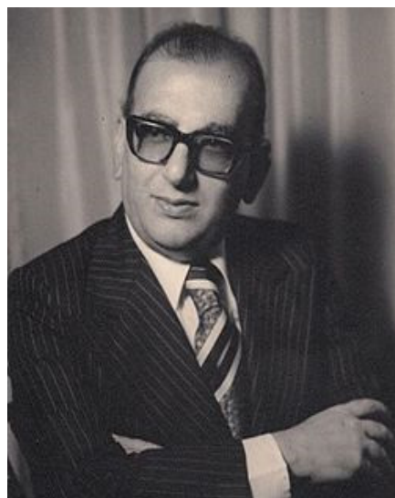
الرئيف شاذل طاقه وزير الخارجية العراقي

٢٠ تشرين الأول عام ١٩٧٤ انتقل الى رحمة الله الكاتب والاديب الرئيف شاذل طاقه وزير الخارجية العراقي في الرياط أثناء حضوره اجتماع وزراء الخارجية العرب وهو أحد رواد الشعر الحر ومن اعلام مدرسة الشعر العربي الحديث