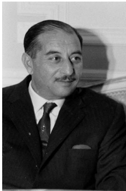
الرفيق الأب القائد أحمد حسن البكر

الفقيد ونضاله الوطني والقومي ومشاركته في الصفوف الاولى في ثورات مايس ١٩٤١ و١٤ تموز ١٩٥٨ و٨ شباط ١٩٦٢ و١٧-٢٠ تموز ١٩٦٨ وودره الهام في الجيش وفي الحزب وفي المنجزات التي تحققت ابات سغله للموقع الاول في قيادة الحزب والدولة وأعلن الحاد في العراق لدة اسبوع على الفقيد الراحل كما ناه الرين القائد المؤسس أحمد ميشيل عفلن والعديد من المسؤولين في الدولة والحزب