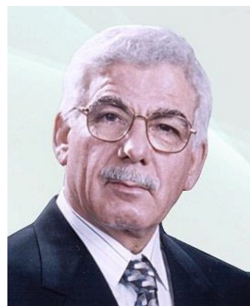
الرئيف الدكتور محسن خليل

١١ تشرين الأول عام ٢٠١٠ انتقل الى رحمة الله الرئيف الناظر الدكتور محسن خليل عضو مكتب العلاقات الخارجية لحزب البعث العربي الاشتراكي سفير العراق في مصر مندوب العراق الدائم لدى جامعة الدول العربية قبل الاحتلال