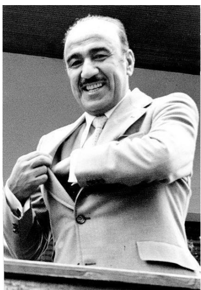
الرفيق صالح مهدي عماش

٨ تشرين الاول عام ١٩٦٢ أعلنت بغداد ودمشق عن الوحدة العسكرية بين العراق وسوريا بجيش واحد وقوات مسلحة واحدة بشرت عليها مجلس عسكري اعلى موحد يضم اعضاء من القطرين برئاسة القائد العام للقوات المسلحة الوحدة، وتم اختيار الرين صالح مهدي عمات الذي كان آنذاك برتبة رين ركن ويشغل موقع وزير الدفاع في العراق قائما عاما للقوات المسلحة الوحدة بينما اختيرت دمشق كمقر للقيادة الوحدة للجيش، الا أن هذه الخطوة الوحدوية الامة على طريق الوحدة الاتحادية بين القطرين اغتالها ردة ١٨ تشرين الثاني ١٩٦٢ السرداء