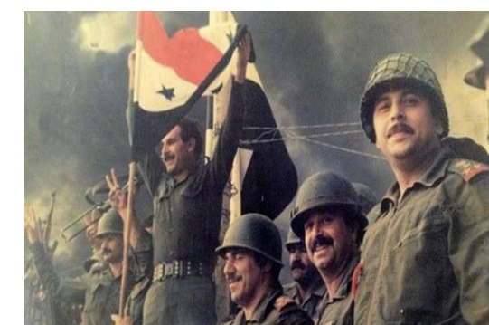
ابناء شعبنا المجاهد يستعيدون الذكرى الحادية والثلاثين لمركبة تحرير الضوا الخالدة