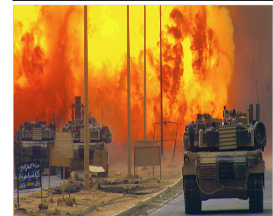
تهية للمقاومة العراقية الباسلة في ذكرى انطلاقها السادسة عشرة

بسم الله الرحمن الرحيم اللّٰدِيْنَ قَالَ هُمُ النَّاسُ اِنَّ النَّاسَ قَدْ جَمَعُوْا لَكُمْ فَاخْشَوْهُمْ فِرًاۗدَهُمْ فِرًاۗدَهُمْ اِيۡمًاۗنًا وَقَالُوۡا حَسْبُنَا اللّٰهُ وَنِعْمَ الْوَكِيۡلُ ﴿١٠٠﴾ فَانْقَلَبُوۡا بِنِعْمَةِ رَبِّهِۦٓ وَفَضْلِ لِّهِۦ وَفَضْلِ لِّمُسْتَهۡمِۢمٍ سُوۡءٍ وَّاَتَّبَعُوۡا رِضْوَانَ اللّٰهِ وَاللّٰهُ ذُوۡ فَضْلٍ عَظِيۡمٍ صدق الله العظيم