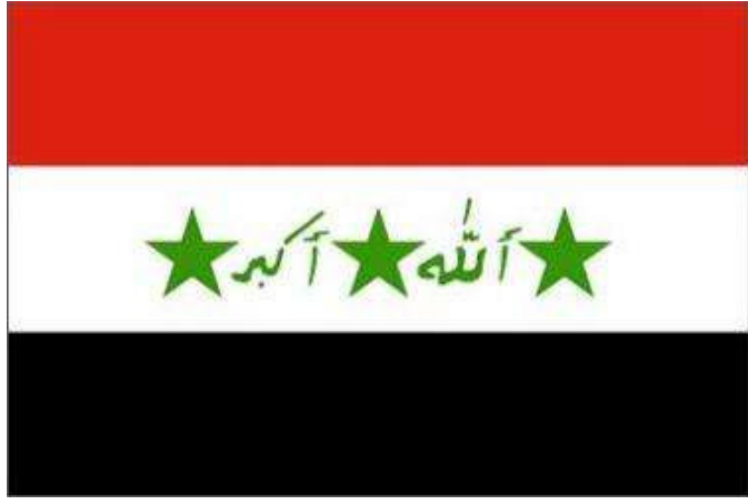
علم العراق الشرعي المعدل عام ١٩٩١

٢١ شباط عام ١٩٥٨ تم اجراء الاستفتاء في مصر وسوريا على الوحدة بين القطرين تحت اسم الجمهورية العربية المتحدة وقد وافق الشعب في القطرين بأغلبية ساحقة على الوحدة