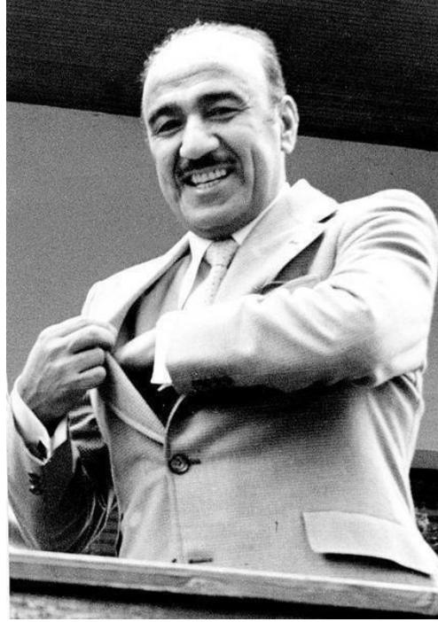
الرفيق صالح مهدي عماش

✦ ٨ شباط عام ١٩٧٠ تأسيس الجيش الشعبي كسند وظهير شعبي لجيش العراق الباسل وقد كان له دور حيوي ومهم في قادسية صدام المجيدة ومنازلة أم المعارك الخالدة