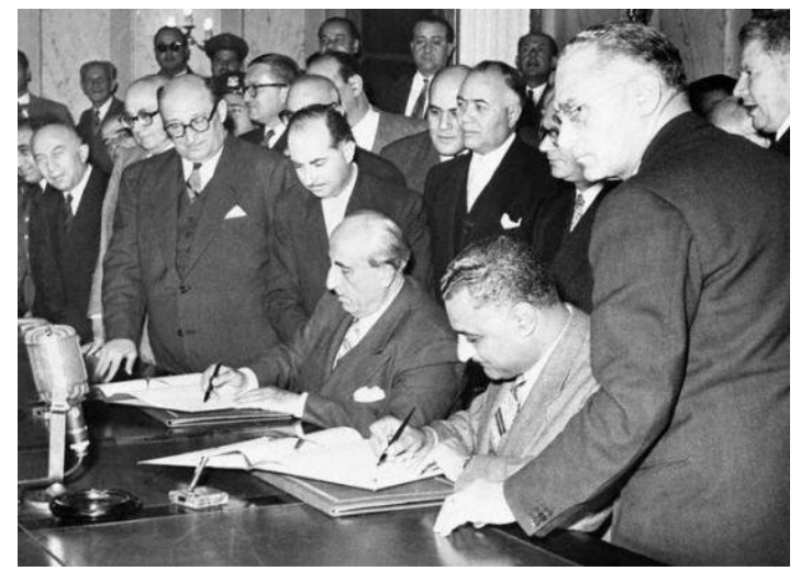
التوقيع على ميثاق الوحدة بين مصر وسوريا عام ١٩٥٨

✦ ١ شباط عام ١٩٥٨ توقيع ميثاق الوحدة بين مصر وسورية في جمهورية عربية متحدة تذب فيها الشخصية الاعتبارية للقطين العربيين وتنتقل لدولة الوحدة الجديدة