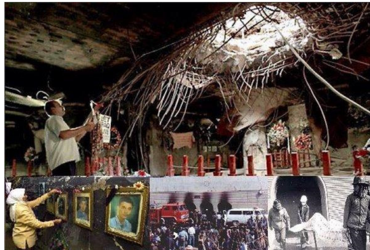
ملجأ العامرية بعد العدوان الغاشم عام ١٩٩١

١٣ شباط عام ١٩٩١ أقدم العدوان الأمريكي الأطلسي الثلاثيني الغاشم على ارتكاب جريمة قصف ملجأ العامرية الذي يضم العديد من المدنيين العزل استشهد منهم المئات وأغلبهم نساء وأطفال