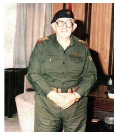
الفريق الأول الركن عبد الجبار شنشل وزير الدولة للشؤون العسكرية

20 ايلول 2014 انتقل إلى رحمة الله الفريق الأول الركن عبد الجبار خليل شنشل وزير الدولة للشؤون العسكرية قبل احتلال العراق والذي شغل في وقت سابق موقعي وزير الدفاع ورئيس أركان الجيش