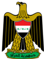
القيادة العامة للقوات المسلحة العراقية