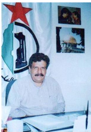
الشهيد محمد عباس أبو العباس

٨ آذار عام ٢٠٠٤ استشهاد المناضل محمد عباس أبو العباس الأمين العام لجبهة التحرير الفلسطينية وأحد قادة المقاومة الفلسطينية الأسير في معتقلات الاحتلال الأمريكي في العراق