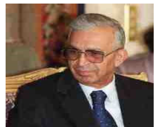
الله الرفيق سعدون حمادي

❖ ١٥ آذار عام ٢٠٠٧ انتقل إلى رحمة الله الرفيق المناضل سعدون حمادي رئيس المجلس الوطني قبل الاحتلال ويعد الفقيد من الرعيل الأول لحزب البعث العربي الاشتراكي في العراق وقد سبق له نيل عضوية قيادة قطر العراق للحزب ومجلس قيادة الثورة كما سبق له أن شغل موقع وزير الاصلاح الزراعي بعد ثورة ٨ شباط ١٩٦٣ ورئيس مجلس الوزراء ووزير الخارجية والنفط بعد ثورة ١٧ - ٣٠ تموز ١٩٦٨ والعديد من المهام في الدولة والحزب