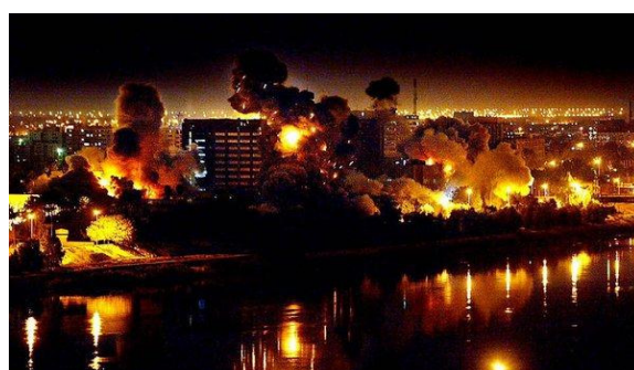
بغداد فجر يوم العدوان الغاشم على العراق في ٢٠ آذار ٢٠٠٣

❖ ٢٠ آذار عام ٢٠٠٣ بدأ العدوان الأمريكي البريطاني الغربي الصهيوني الأطلسي الغاشم على العراق بمشاركة إيرانية غير مباشرة لتنتقل معركة الحواسم وقد استبسل شعب العراق في المقاومة التي قادها صناديد البعث وأبطال القوات المسلحة