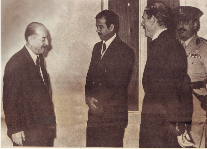
الأب القائد احمد حسن البكر رحمه الله .. شهيد العصر القائد صدام حسين رحمه الله .. الرفيق المجاهد الأمين العام للحزب عزة ابراهيم الدوري حفظه الله أخذت هذه الصورة يوم تنحي الأب القائد عن مهامه الحزبية والرسمية منتصف تموز ١٩٧٩

أسرة تحرير الثورة تهني الرفيق المجاهد عزة ابراهيم الدوري الأمين العام للحزب القائد الأعلى للجهاد والتحرير والرفاق الأعضاء القيادتين القومية والقطرية والرفاق كافة وأبناء شعبنا العراقي والعربي بالذكري الحادية والأربعين لثورة البعث في العراق ثورة السابع عشر - الثلاثين من تموز العظيمة